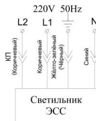
Светильник с аварийным режимом L1- основное питание L2 -контроль присутствия U (подключать от эл. сети 220В фаза)